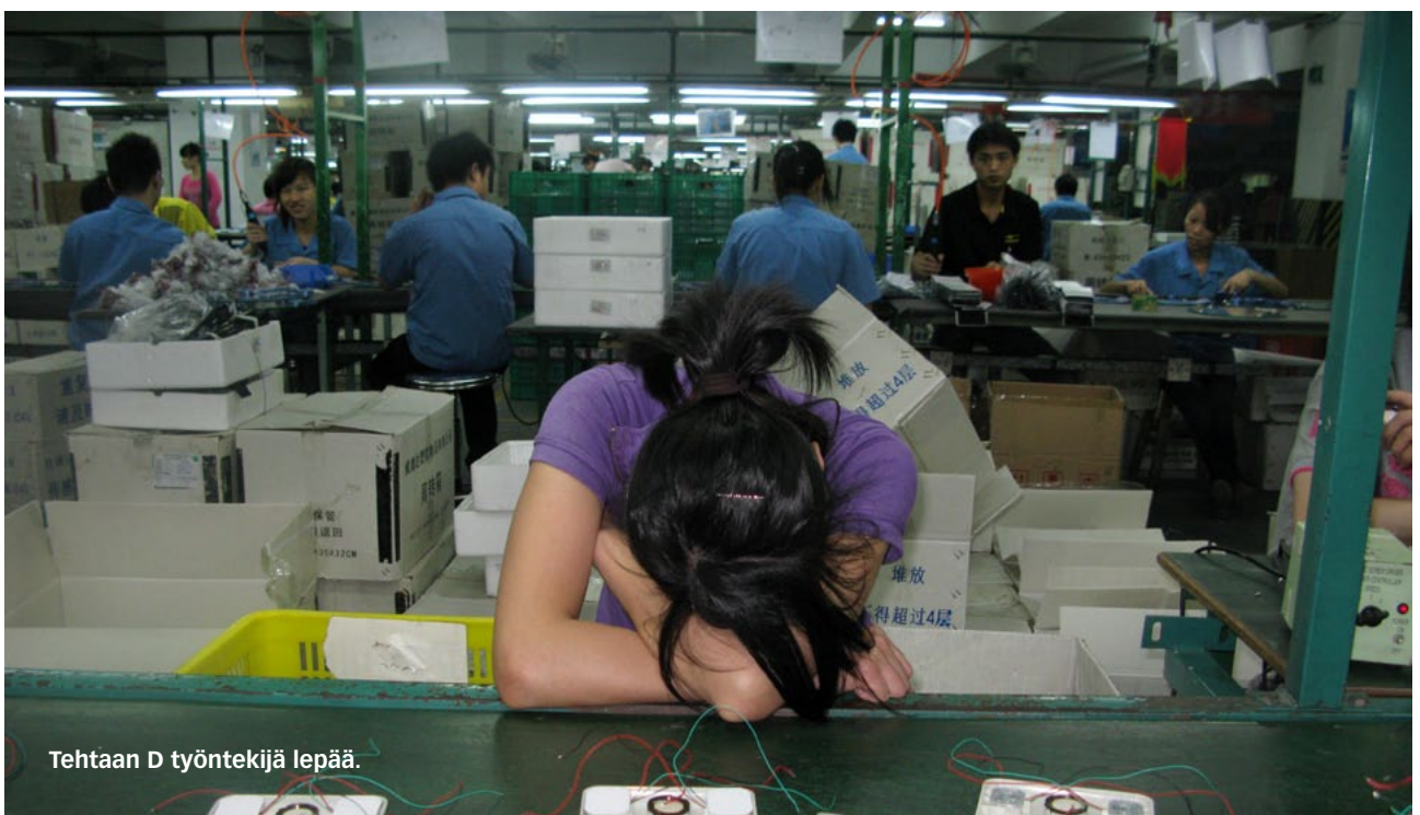
Tehtaan D työntekijä lepää.