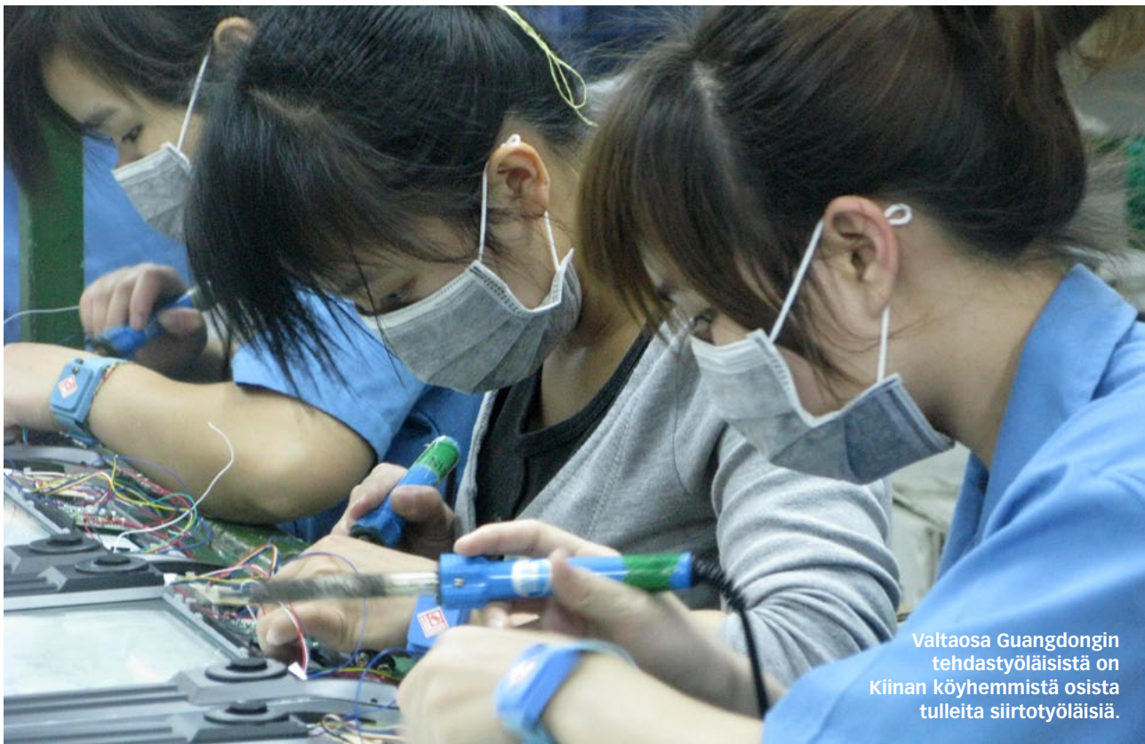
Valtaosa Guangdongin tehdastyöläisistä on Kiinan köyhemmistä osista tulleita siirtotyöläisiä.

Selvitystä täydentää kenttätutkimuksen yhteydessä kuvattu lyhytdokumentti, joka on niin ikään katsottavissa Finnwatchin kotisivuilla.