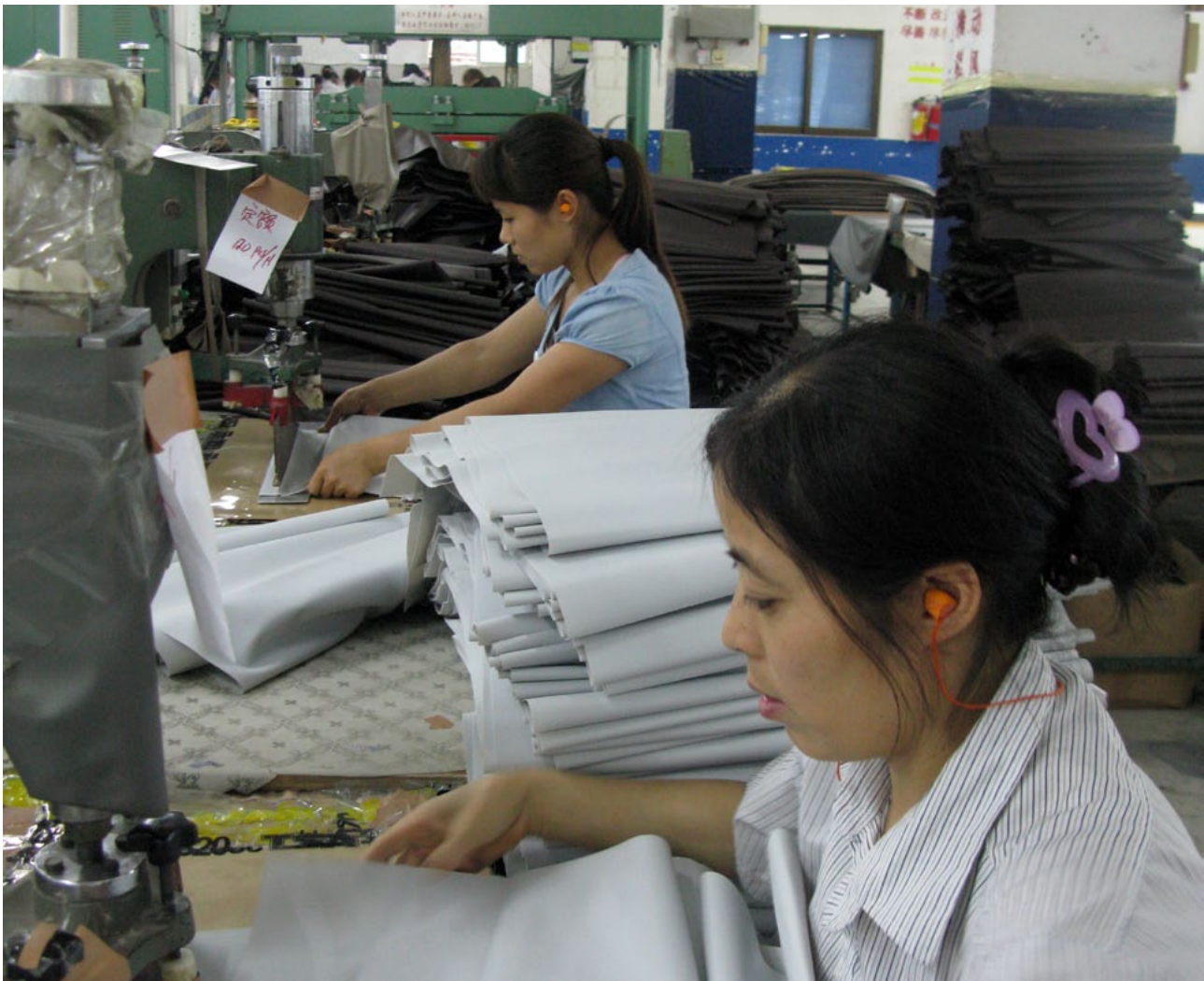
Tehtaan A työntekijät tekivät kertomansa mukaan usein viisi tuntia ylitöitä kuutena päivänä viikossa. Omistajan mukaan ylitöitä tehtiin arkena 2,5 ja lauantaisin 8 tuntia.

Haastatelluista 26 oli naisia ja 20 miehiä. Heidän ikänsä vaihteli 20:n ja 50 vuoden välillä. Enemmistö oli 30–40 vuotiaita. Useimmiten he olivat työskennelleet tehtaassa yhdestä kolmeen vuoteen. Jotkut olivat juuri aloittaneet, kun taas muutamat olivat työskennellyt samassa paikassa jo 6–7 vuotta. Haastatellut työskentelivät muun muassa kokoonpano-, paketointi-, painevalu- ja metalliosastoilla.