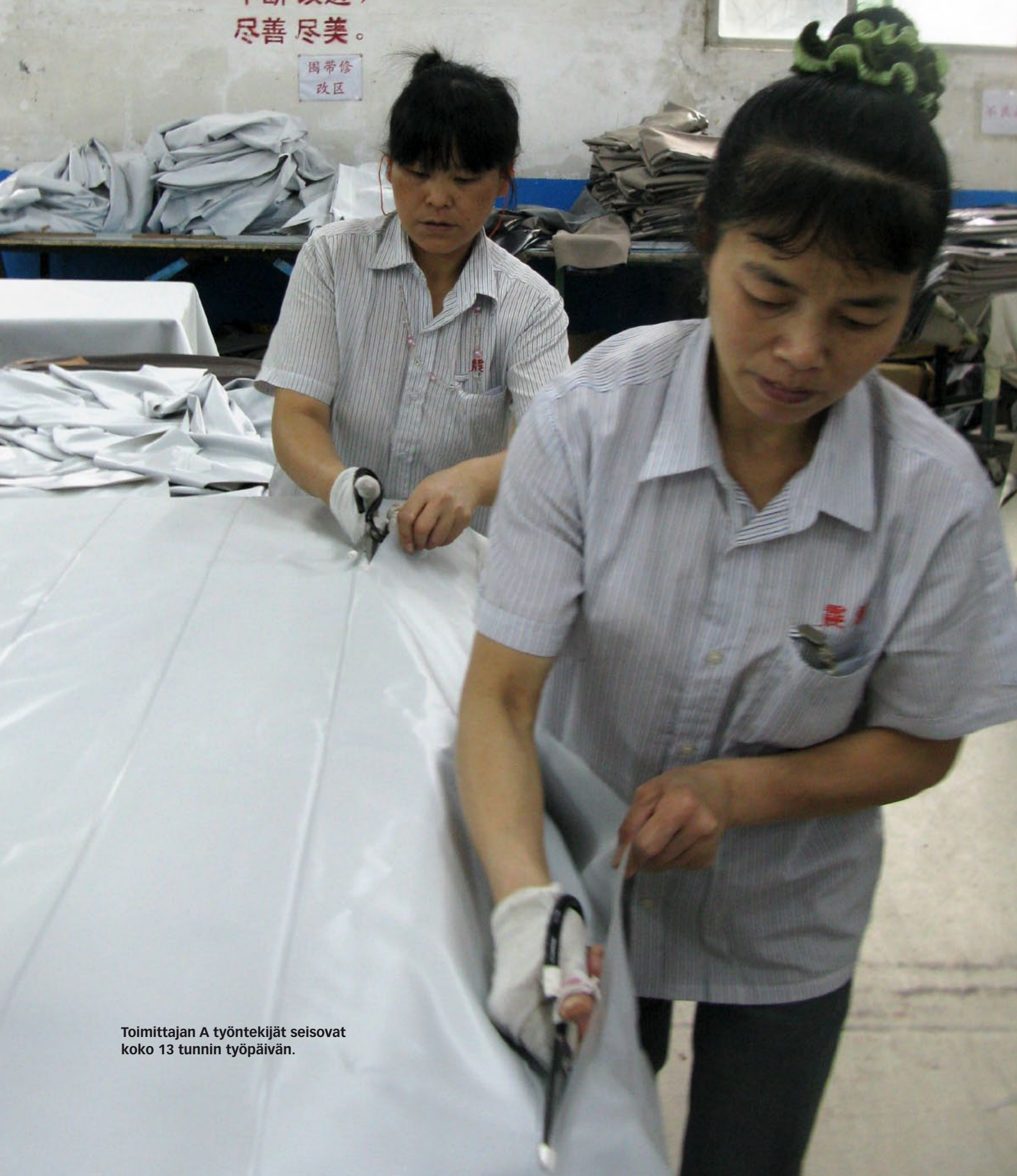
Toimittajan A työntekijät seisovat koko 13 tunnin työpäivän.