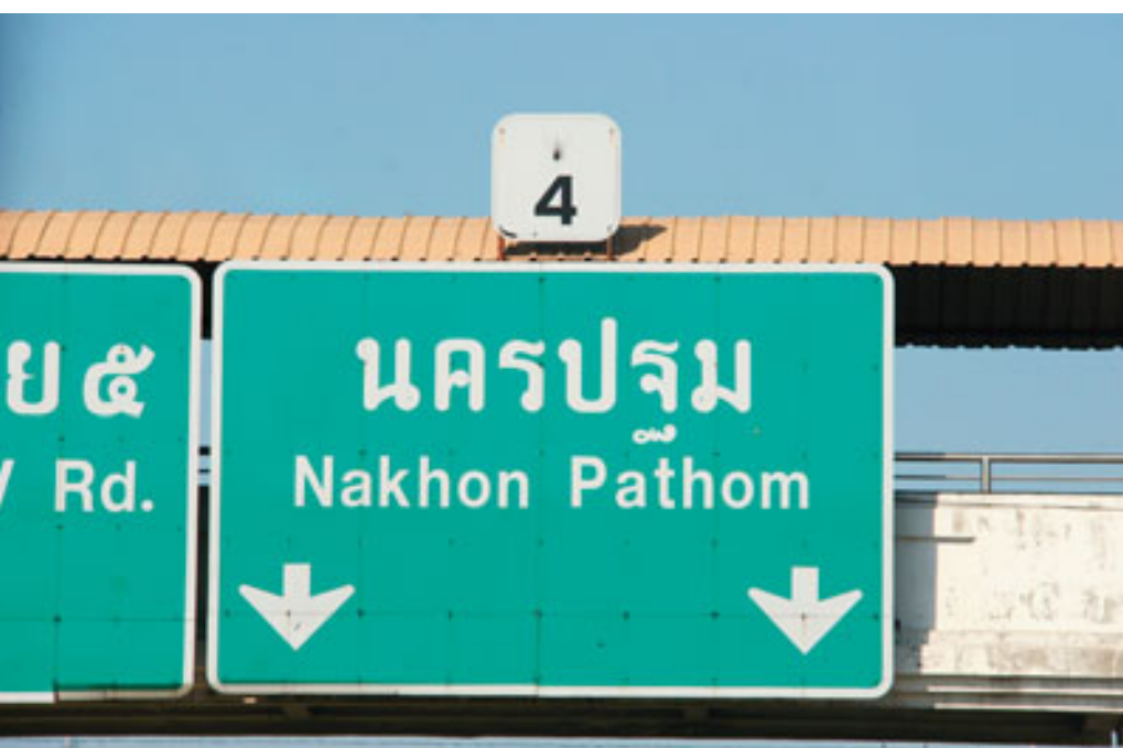
Iittalalle ja Marimekolle tuotteita tuottava tehdas toimii Keski-Thaimaassa Nakhon Pathomin maakunnassa.

Tutkittu tehdas sijaitsee Thaimaassa Nakhon Pathomin maakunnassa lähellä Thaimaan pääkaupunkia Bangkokia. Tehtaan 175 työntekijästä suurin osa on thaimaalaisia ja noin 20 työntekijöistä on Burmasta Thaimaahan muuttaneita siirtotyöntekijöitä. Siirtotyöntekijöistä lähes kaikki kuuluvat Burman Karenin kansaan.